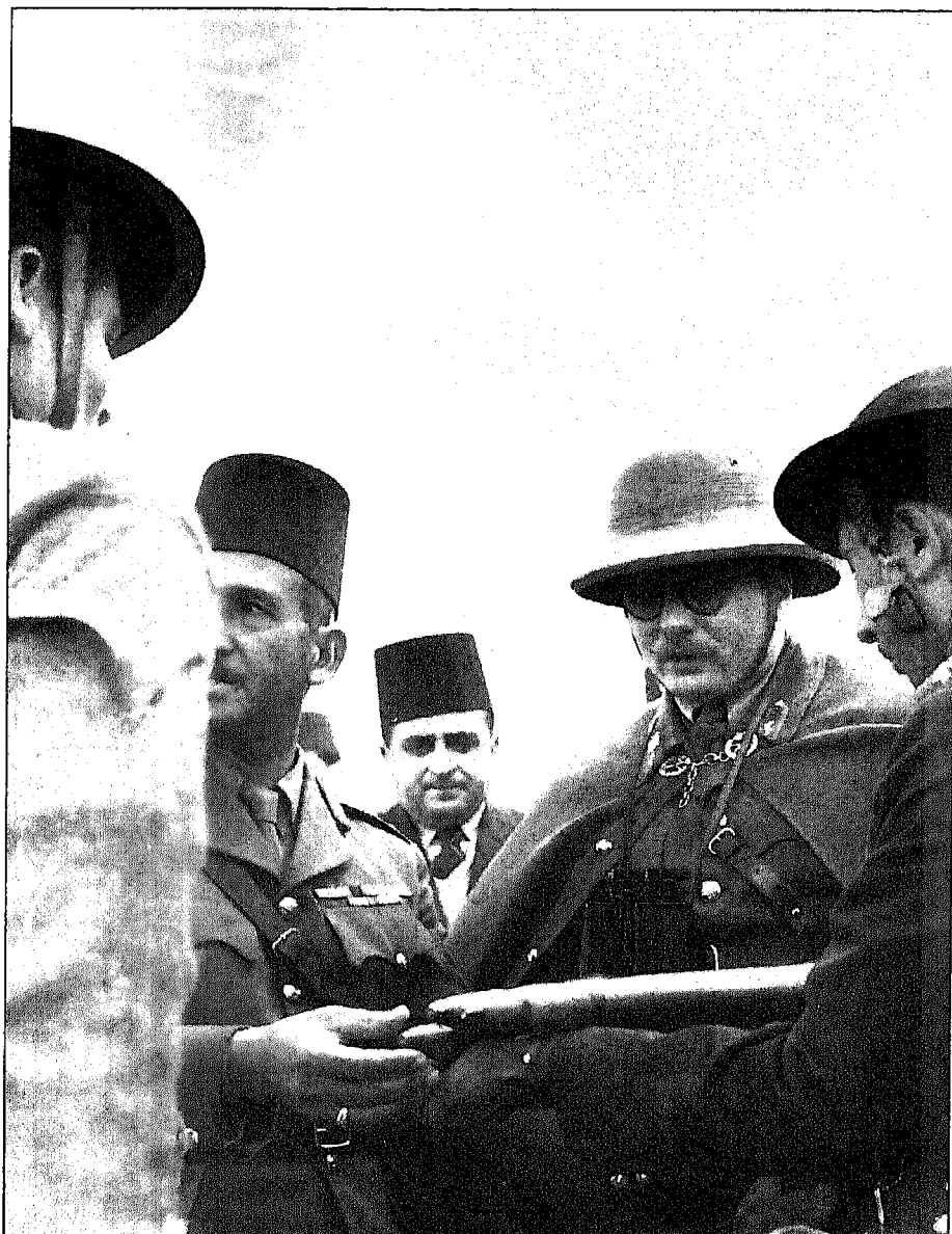
الملك فاروق في زيارة لإحدى الوحدات العسكرية ويظهر كريم ثابت خلفه